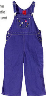
Lila Latzhose mit Buttons

Gegliedert in sechs Bereiche behandelt die Ausstellung die Kontroverse um Sexualität und Geschlechterbeziehungen zwischen Liberalisierung, Werteverfall und Pluralisierung. Die Ausstellung besteht aus Plakaten, Zeitschriften, Fotografien sowie einigen dreidimensionalen Objekten. Eine lila Latzhose ist Sinnbild der politischen Emanzipation. Zensierte LP-Covers von Roxy Music und den Rolling Stones werden zum Manifest einer ganzen Bewegung. Für eine aktive Auseinandersetzung mit den Inhalten sorgen interaktive Elemente, beispielsweise eine Befragungstafel zum Thema „Wer hat Sie aufgeklärt?“.